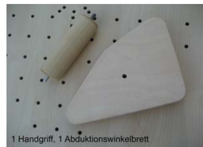
1 Handgriff, 1 Abduktionswinkelbrett