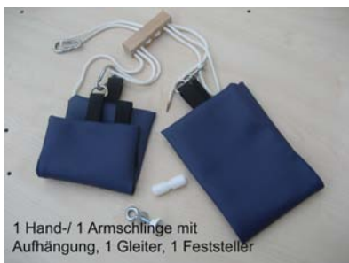
1 Hand-/ 1 Armschlinge mit Aufhängung, 1 Gleiter, 1 Feststeller