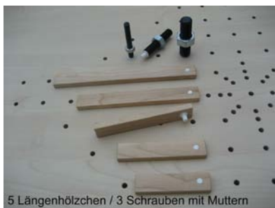
5 Längenhölzchen / 3 Schrauben mit Muttern