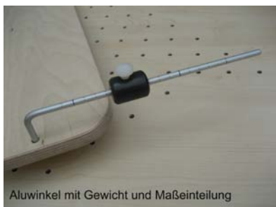
Aluwinkel mit Gewicht und Maßeinteilung