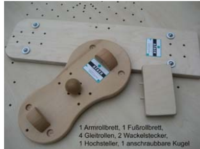
1 Armrollbrett, 1 Fußrollbrett, 4 Gleitrollen, 2 Wackelstecker, 1 Hochsteller, 1 anschraubbare Kugel