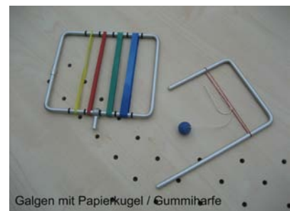
Galgen mit Papierkugel / Gummihärfe