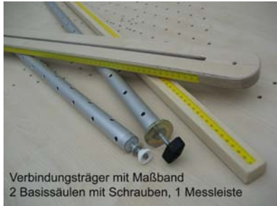
Verbindungsträger mit Maßband 2 Basissäulen mit Schrauben, 1 Messleiste

(auf dem Ablagebrett am BIBER-Therapietisch und im Zubehörkoffer)