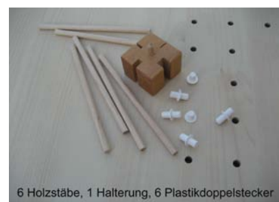
6 Holzstäbe, 1 Halterung, 6 Plastikdoppelstecker