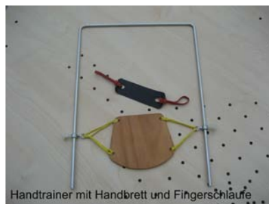
Handtrainer mit Handbrett und Fingerschleife