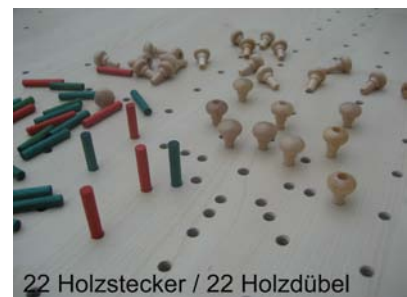
22 Holzstecker / 22 Holzdübel