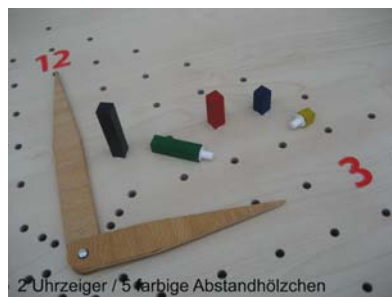
2 Uhrzeiger / 5 farbige Abstandhölzchen